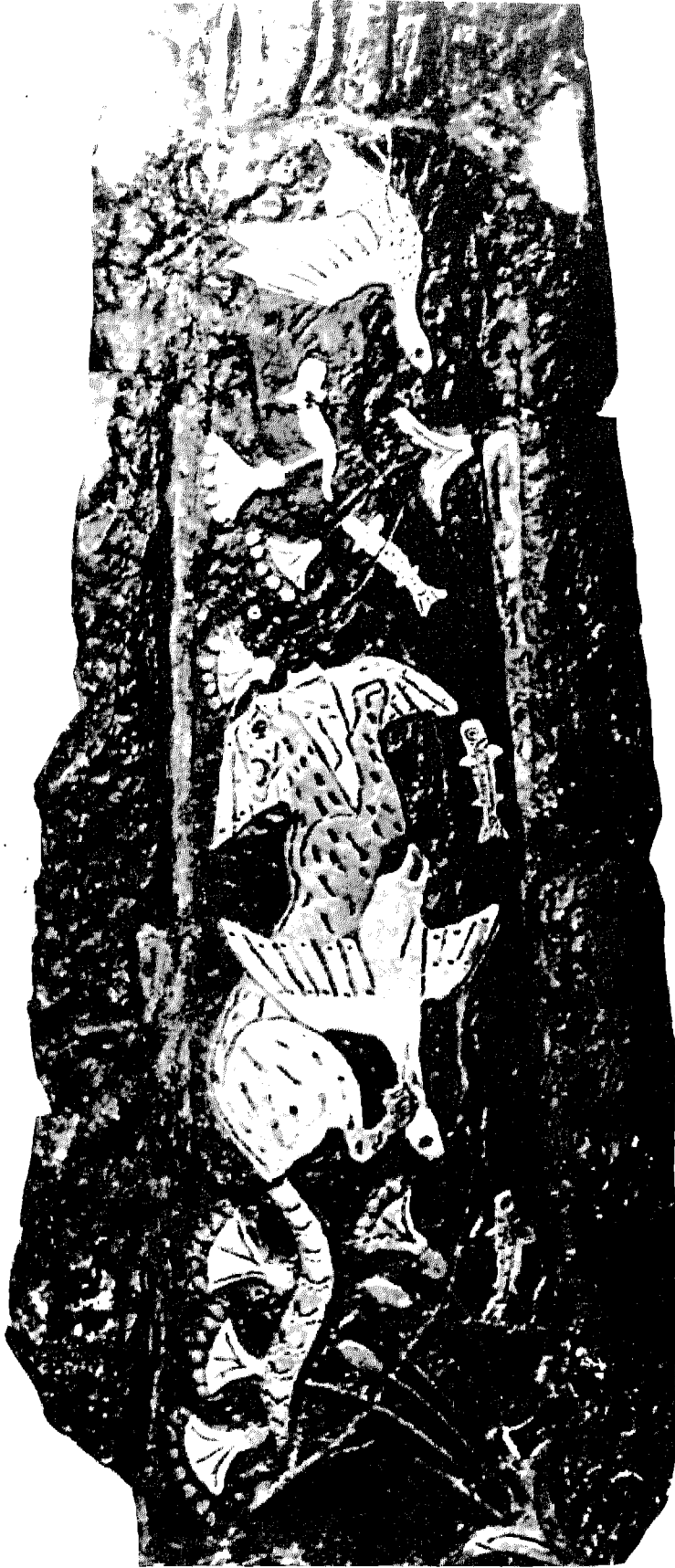
شكل ه - خنبر طعم يصله ينظر يتناول عليه قطر برى ينقض على البطة في بحر به اسماك و نبات البردى ، وصنعت هذه الدروع الفنية من الذهب والفضة - مجموعة المتاحف الأولى .